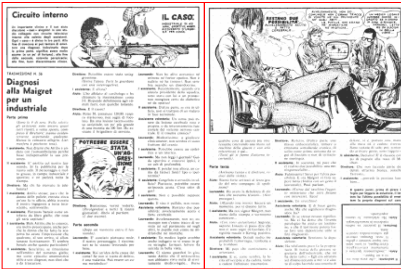
Le due pagine della "clanicommedia" n. 56, da Tempo Medico