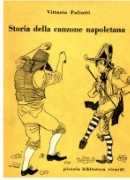
Storia della canzone napoletana di Vittorio Paliotti Piccola biblioteca Ricordi n. 3 (1958)