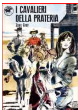
I cavalieri della prateria di Zane Grey copertina di Guido Crepax Tascabili Sonzogno n. 1