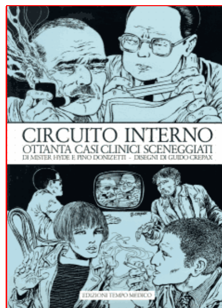
Circuito Interno Edizioni Tempo Medico 1977