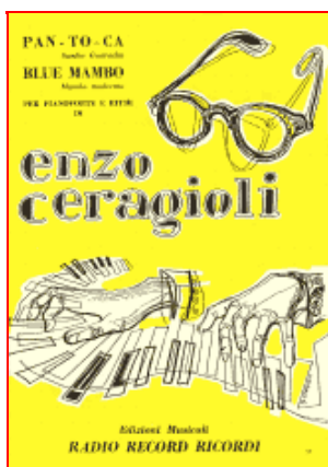
Spartito per le Edizioni musicali Ricordi