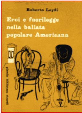
Eroi e fuorilegge nella ballata popolare americana di Roberto Leydi Piccola biblioteca Ricordi n. 1 (1958)