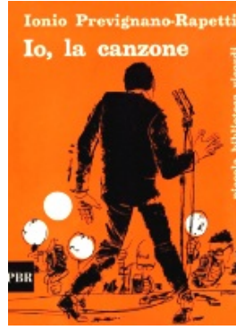
Io, la canzone di Ionio Prevignano-Rapetti Piccola biblioteca Ricordi n. 18 (1962)